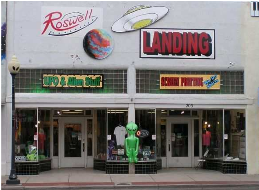
Aliens und UFOs sind in Roswell ein Wirtschaftsfaktor

Damit ist natürlich auch die Zukunft des Museums gesichert, weil nun die Touristen weiter das Museum besuchen werden. Vielleicht sogar noch vermehrt, da ja jetzt der Mitbegründer des Museums Walter Haut mit dieser 2. EV selbst zum alleinigen „Kronzeugen“ für die Existenz eines angeblich geborgenen UFO-Wracks aufgestiegen ist.