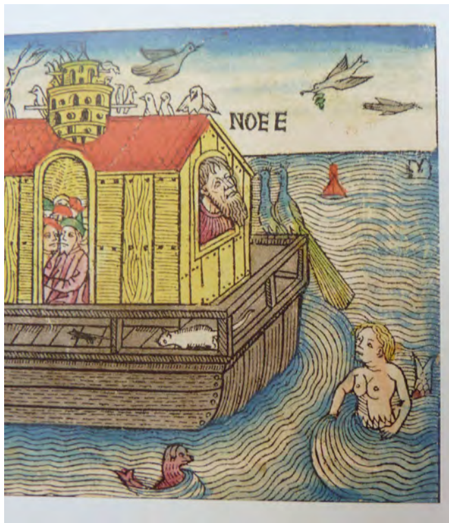
Abb. 1: Noah und die Seejungfrau (aus: Scribner 2020, Merpeople , S. 50)

„One mermaid [...] with bare breast and blonde hair, seems to beckon to Noah as he fearfully glances out of a window“, erklärt Scribner (S. 50) diesen Holzstich: Eine blonde und barbusige Seejungfrau lockt Noah an, der furchtsam aus dem Fenster blickt – tatsächlich sieht Noah hoch zu der Taube, die den Ölweig bringt, ist also hoffnungsvoll und wird von der Nixe nicht verführt.