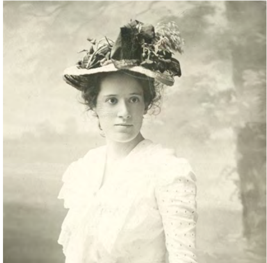
Abb. 1: Fanny Moser zur Studienzeit in München (Ausschn.)

Dass das Leben von Fanny Moser und ihre Arbeit als Parapsychologin auf großes Interesse stoßen, ließ sich gleich zu Beginn des Symposiums erkennen. Viele Menschen waren der Einladung gefolgt und nach Freiburg angereist. Auch der Veranstaltungsort in der Universitätsbibliothek Freiburg war gut gewählt, denn Moser hatte dem IGPP auch ihre Privatbibliothek hinterlassen. Ihre Sammlung zum Thema Okkultismus bildete den Grundstock der heutigen parapsychologischen Spezialbibliothek mit annähernd 60.000 Bänden, die in Deutschland und auch international wohl einzigartig ist.