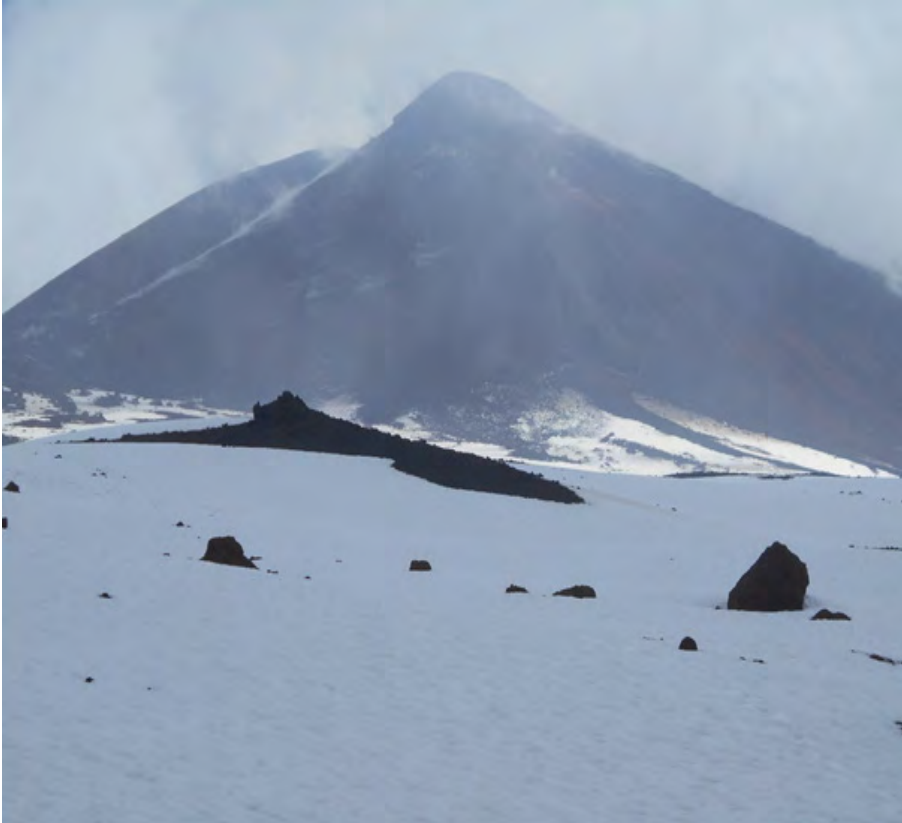
Abb. 2: Der Ätna, gesehen von einem Standort auf etwa 2.900 m Höhe vom Südaufstieg aus