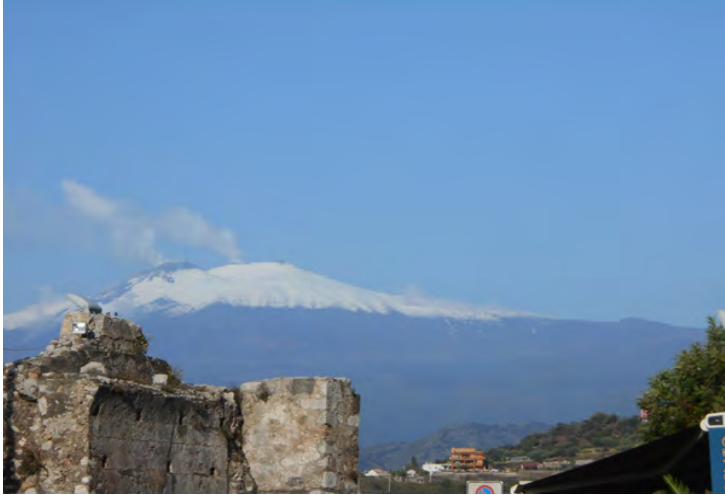
Abb. 1: Der Ätna von der Porta Catania in Taormina aus gesehen.