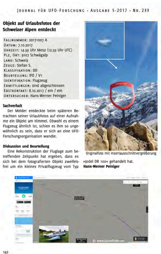
Figure 1. Example of UAP single case study documentation in the GEP’s Journal für UFO-Forschung (Peiniger, 2017).

This is easy to see when comparing different positions on “famous,” frequently published UFO cases. Moreover, the problems of reliability and comparability seem to increase with the degree of “strangeness” of a single case. While strangeness itself will be the third key issue reflected on in a later subsection, the more anomalies arise in a UFO experience, the less reliable and the less comparable the characteristics of this experience become. This is most relevant in so-called