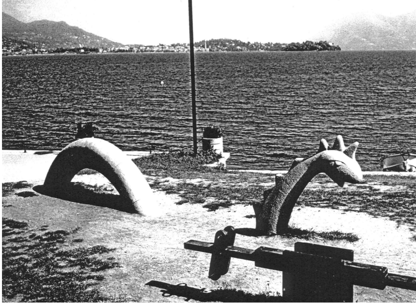
Abbildung 4: Die „Seeschlange von Baveno“.

Am 15. Oktober 1988 berichtete die Schweizer Zeitung Glerner Nachrichten , man habe im Langensee riesige Fische gefangen: „Zu Besorgnis Anlass gibt da schon eher das ungewöhnliche Tier, das aus dem Langensee auf italienischer Seite gefischt wurde. Es handelt sich um einen Wels ... Durch den Po und seinen Zufluss Ticino haben die Welse nun anscheinend den Weg in den Langensee gefunden“ (Herger 1988). Aber Welse ( Silurus glanus ) sind, so Crenna (2002), erst „vor kurzem“ in den Lago Maggiore eingeführt worden. Mittlerweile haben sie sich so vermehrt, dass sie eine Gefahr für die alteingesessenen Fischarten darstellen. Die Sichtung einer Seeschlange mit Pferdekopf aus dem Jahr 1934 können sie nicht erklären.